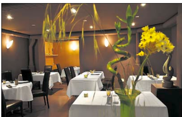
Wohlfühleffekt im Gourmetrestaurant La Tavola Pronta.