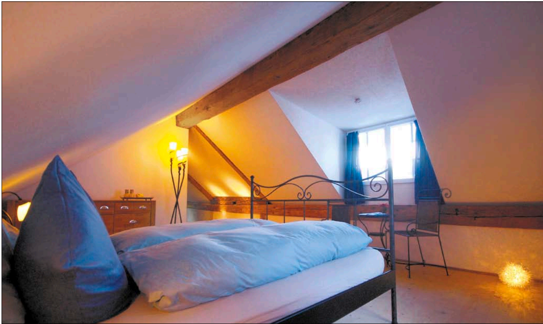
Die Zimmer im Andermatt Hotel The River House sind nach Feng-Shui-Kriterien eingerichtet. Wichtig sind die richtigen farblichen Akzente.