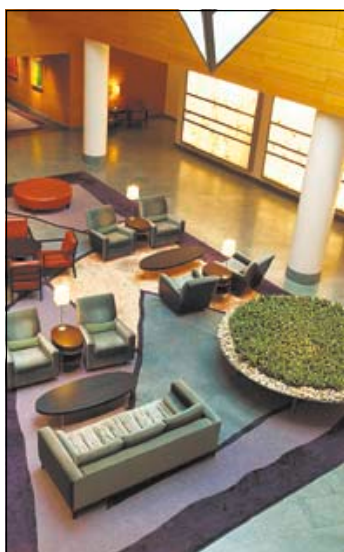
Nach Feng-Shui: Lobby im Hotel Hyatt in Berlin.